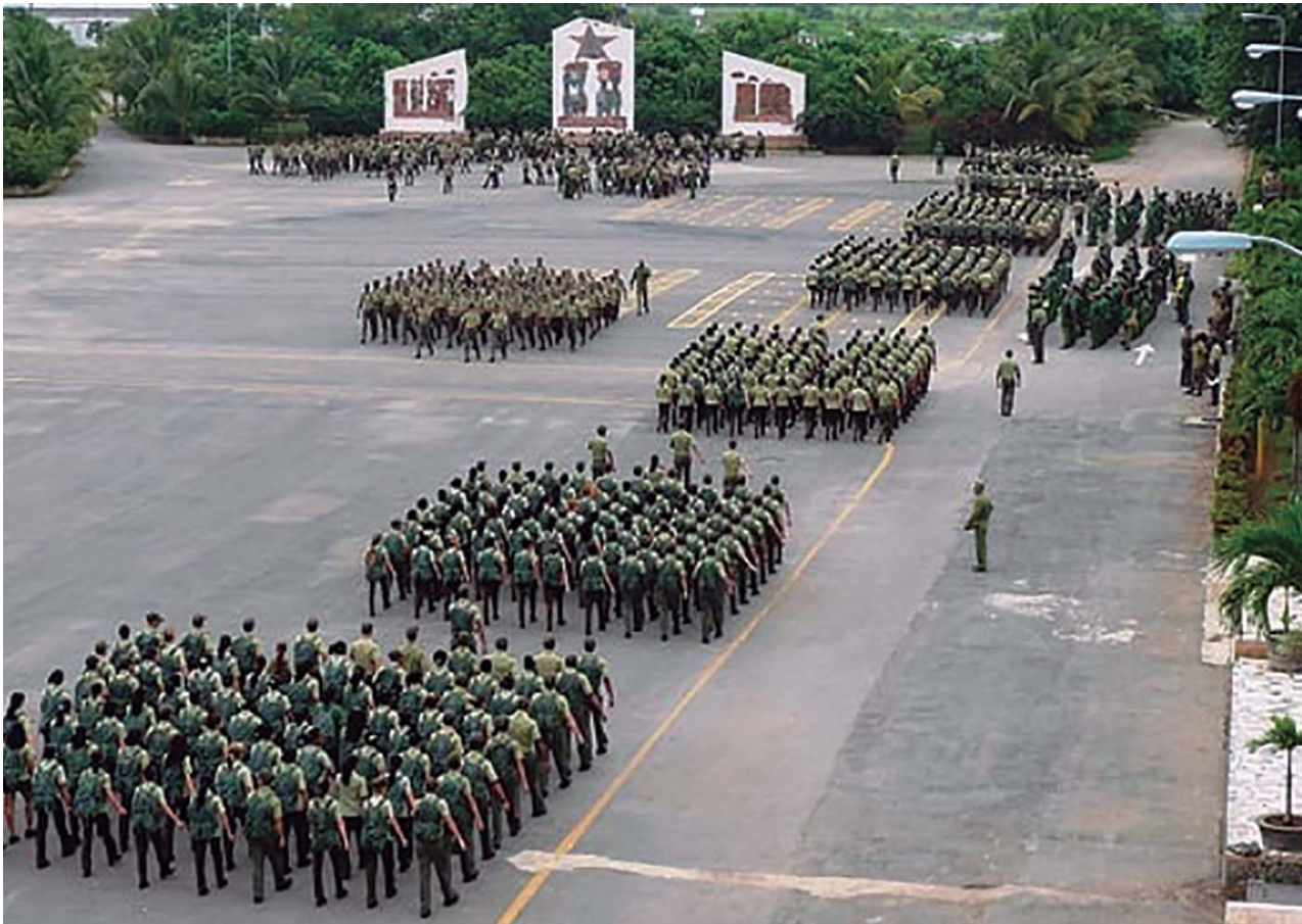
La unidad provincial de patrullas de la capital, colectivo insigne del Ministerio del Interior, de donde salieron los integrantes del heroico batallón de la PNR que combatiera en Playa Girón.

¡Tributo, admiración, gratitud y respeto a los miembros del MININT!