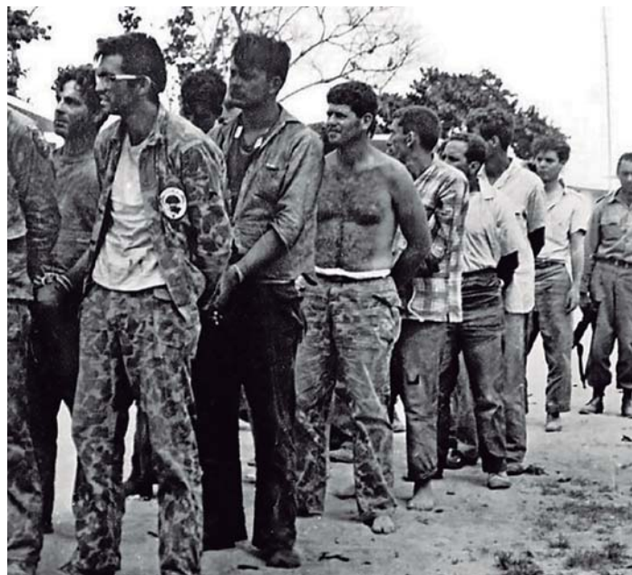
La invasión de los mercenarios fue aniquilada en 65 horas

Los jefes históricos de la Revolución ocuparon sus puestos: Raúl en Oriente, Almeida en el centro, el Che en el extremo occidental, el resto de los comandantes en los puntos asignados.