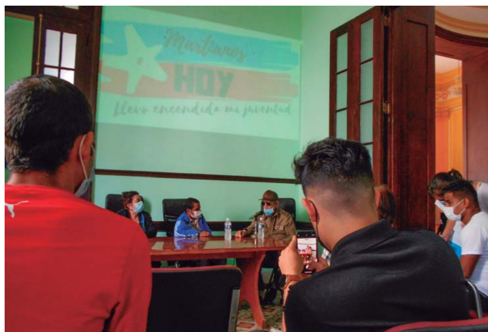
La participación en actividades conjuntas de combatientes y jóvenes contribuye a la educación patriótica, militar e internacionalista de las nuevas generaciones.

9. El presente convenio tendrá vigencia hasta el año 2022, en el que las partes lo ratificarán o renovarán.